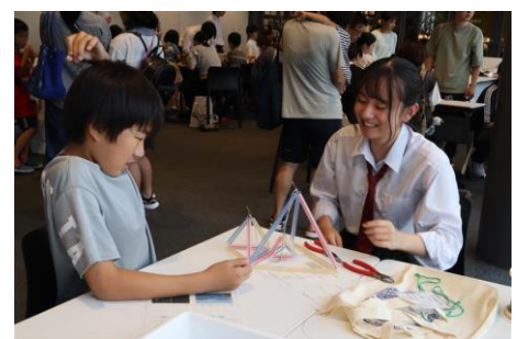
三角の力を活かした カラフル立体模型を作ろう！