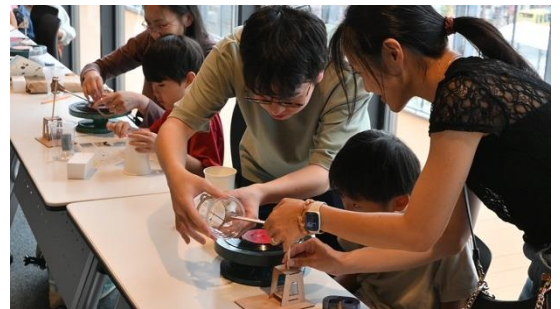
針で聞こえるアナログスピーカーを作ろう！