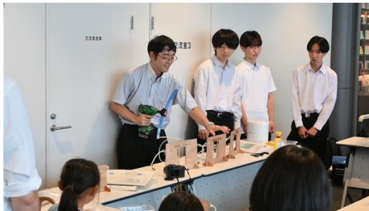
空気で動く機械を作ろう！