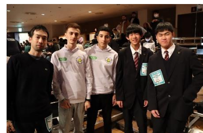
写真4 アゼルバイジャンチームとの技術交流