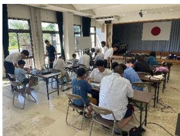
写真3 公民館での高校生による工作教室