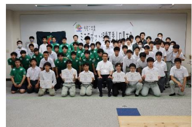
写真2 ミニロボット相撲山口県大会