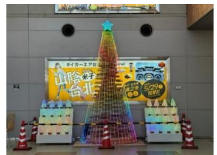
図 5. クリスマスツリー全体