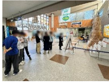
現物でイルミネーションを確認している様子