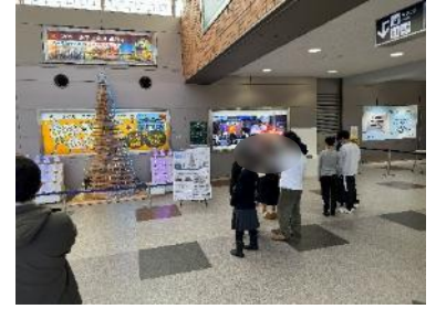
図6. イルミネーションを実装している様子

各々がある程度完成したところで、それらを結合し全体としての出来栄を確認し、班で話し合いながらさらに、イルミネーションの完成度を高めて行った。