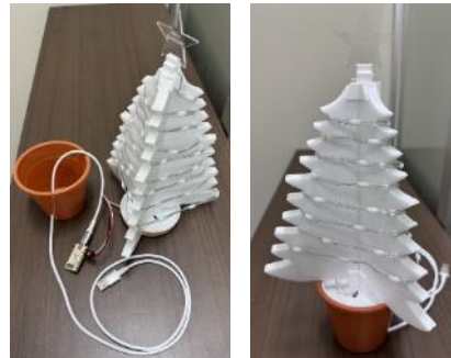
図 2. 作成したミニツリー

その後イルミネーションシーケンスを作成するためのアプリケーションである xlights の使用方法について学習した。xlights とは図 3 のようなアプリであり、タイムラインに音楽、各種エフェクトを配置することにより、音楽に同期させた複数のイルミネーションの光の演出を作成できるものである。図 4 に学習風景を示す。