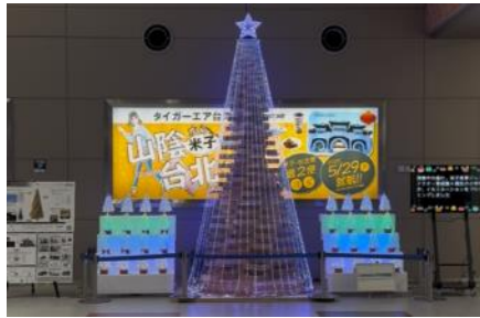
図9.展示中のクリスマスツリー

(期間中「公益財団法人マツダ財団より、事業助成を受けております。」のパネルも設置しました。)