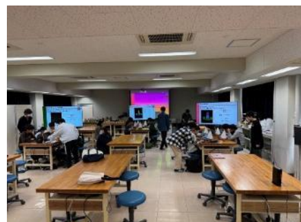
図 4. 学習の様子