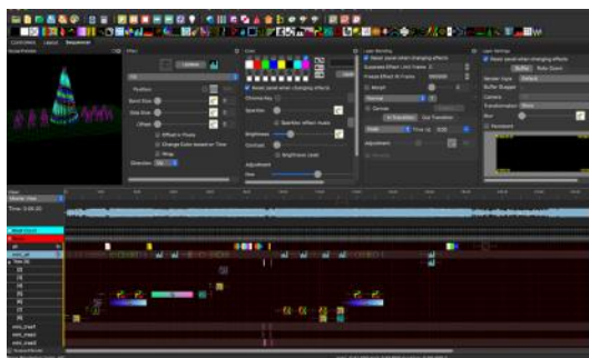
図 3. xlights

その後イルミネーションシーケンスを作成するためのアプリケーションである xlights の使用方法について学習した。xlights とは図 3 のようなアプリであり、タイムラインに音楽、各種エフェクトを配置することにより、音楽に同期させた複数のイルミネーションの光の演出を作成できるものである。図 4 に学習風景を示す。