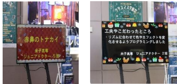
図10.説明を表示したモニター