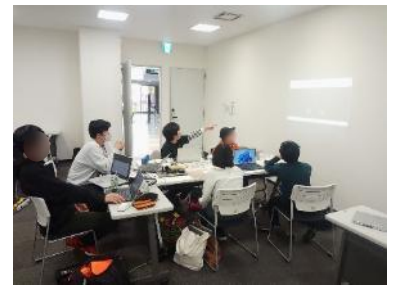
図7. 班での話し合いの様子

次回のイルミネーション披露で発表を行うため、それぞれの班の、「作品のコンセプト」、「実現するために工夫したところ」、「制作の中でこだわったところ」、「作品の見どころ」を用紙にまとめ、各々の発表する内容を分担した。