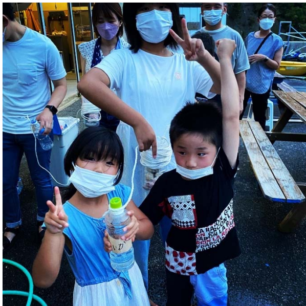
ベイトトラップ制作中（写真2）