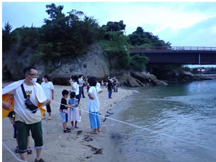
ベイトトラップを海に仕掛ける様子（写真3）