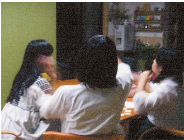
子ども無料学習塾 風景