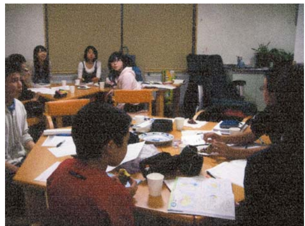
広島大学学生さんたちによる指導のお陰です