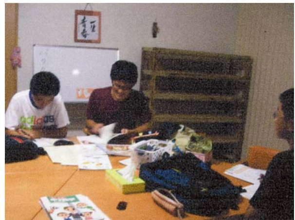
みんなで机を寄せ合って