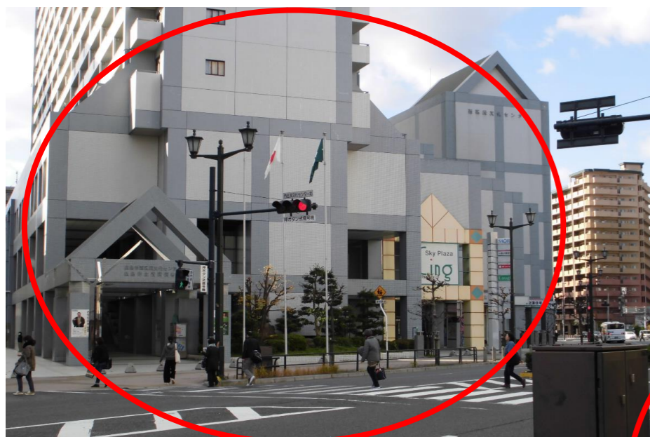
歩行者用押しボタン信号