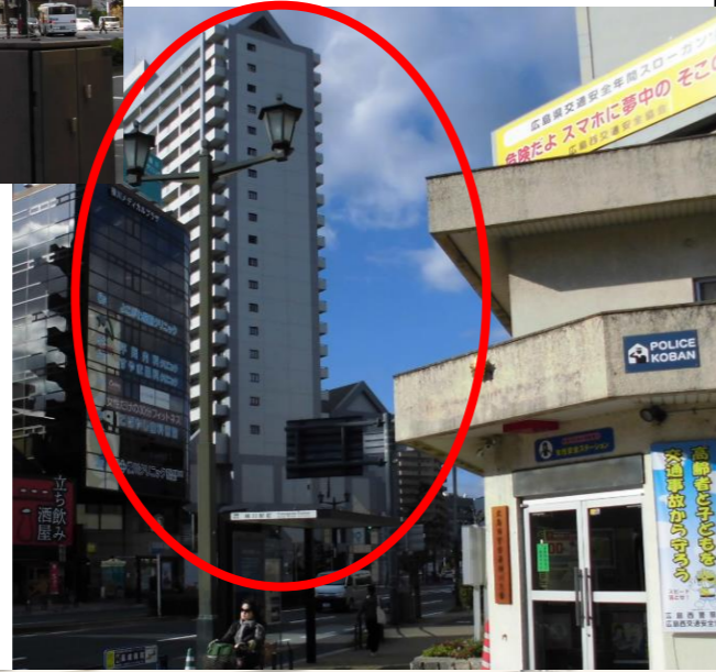
交番前を右に曲がる