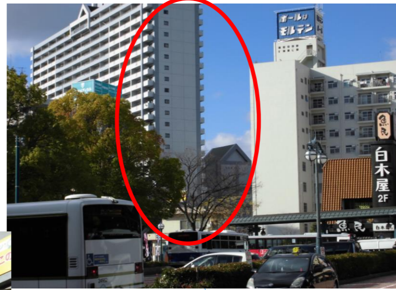
横川駅南口改札前から望遠で見た風景 高いマンションの3階までと右側の低いビルが会場の西区民文化センター（一部図書館）