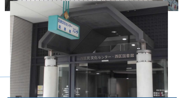
「西区民文化センター・西区図書館 入口」