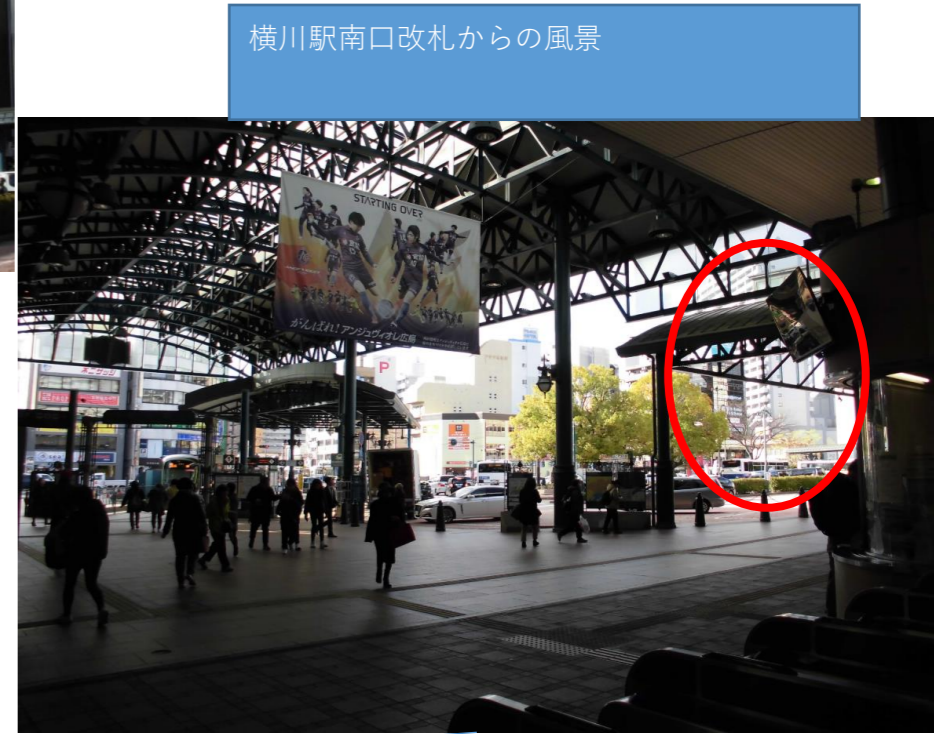
横川駅南口改札からの風景