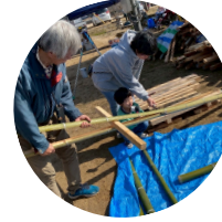
地元の素材で制作

あそび場に来たらまわりをながめて、焚き火・広い地面・空・砂山… わくわくのタネを探してみてくださいね。