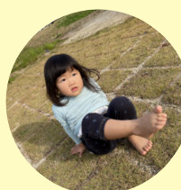
芝生にゴロンも気持ちがいいよ