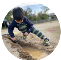
砂・土・水あそび