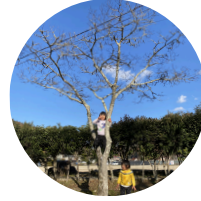
季節さがし・探検