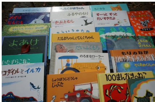
自由に選べる絵本

*もとまち自遊ひろば…毎月第2・4日曜日の10：00-15：00まで「セトラひろしま」が広島市から委託されて運営。不特定多数の親子や小学生が平均して1日100人以上訪れる。