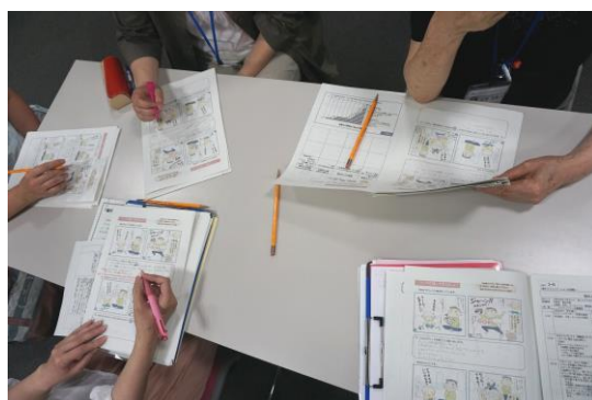
デモ講座のワークに取り組むメンバー