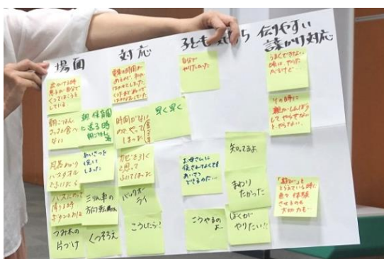
班で話し合った内容を発表