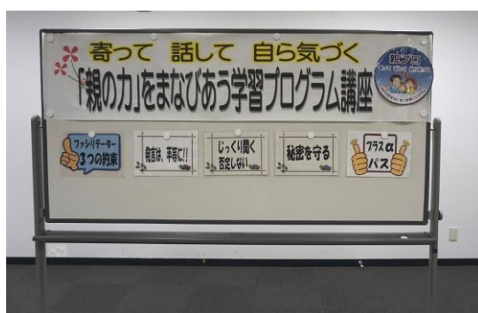
実際の親プロ講座で使う掲示物