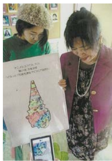
スマホに計測された温度を表示