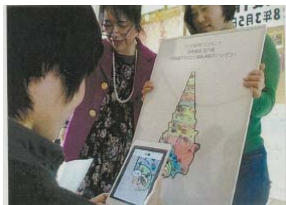
LED 可視光通信のチェック